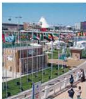
Con Expo, nuove opportunità.

Effetto Expo a Milano nella ristorazione e nel settore turistico. In Toscana l'industria della moda